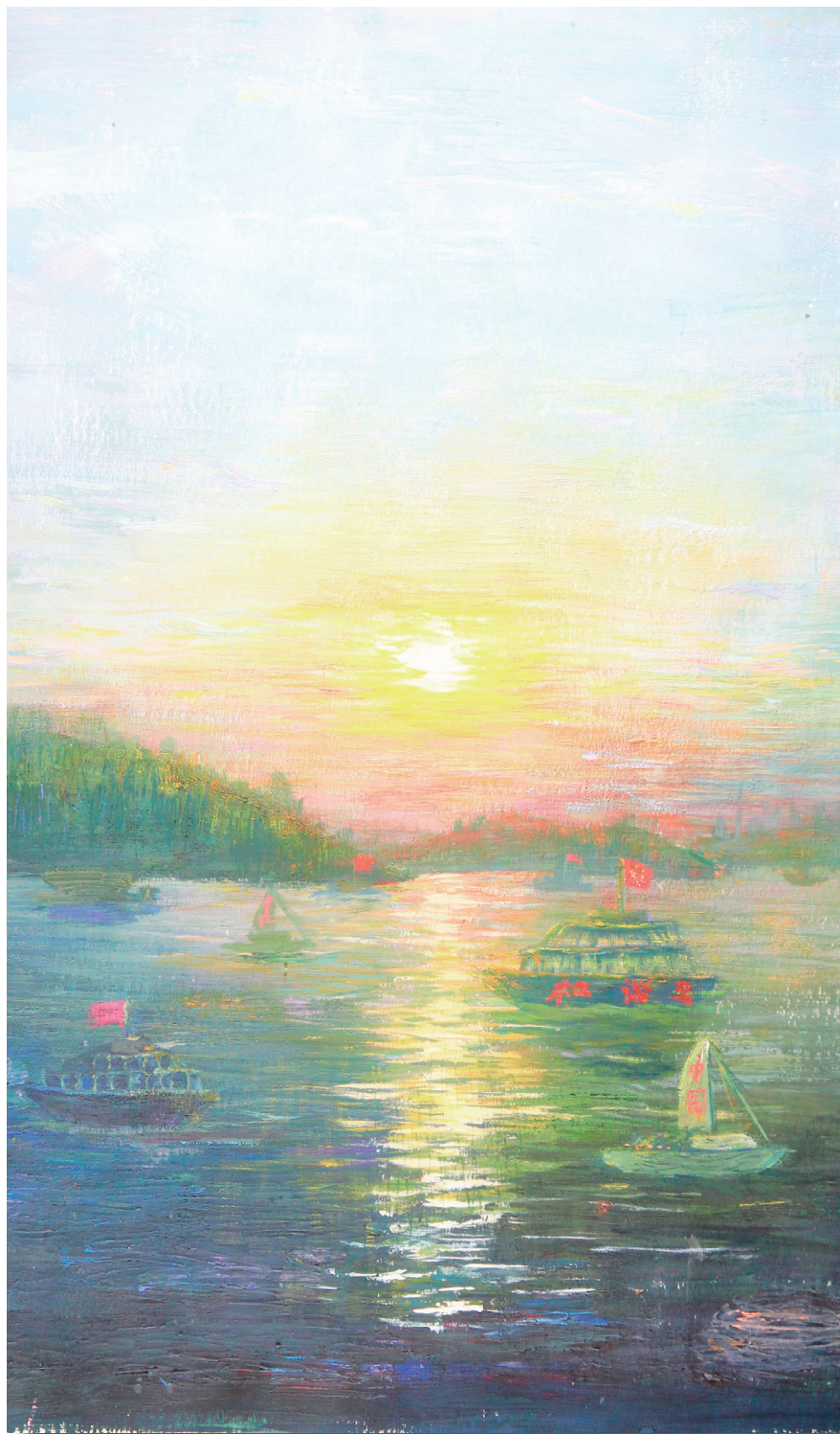
《朝阳秋水与船笛》 境 172 谭燕