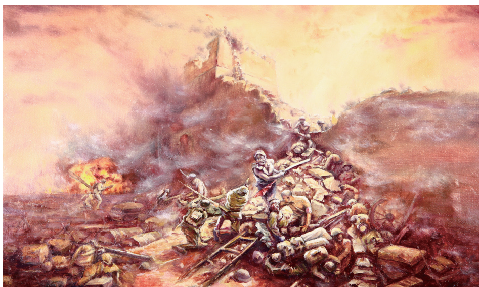
《衡阳保卫战》 视传 161 裴莉莹