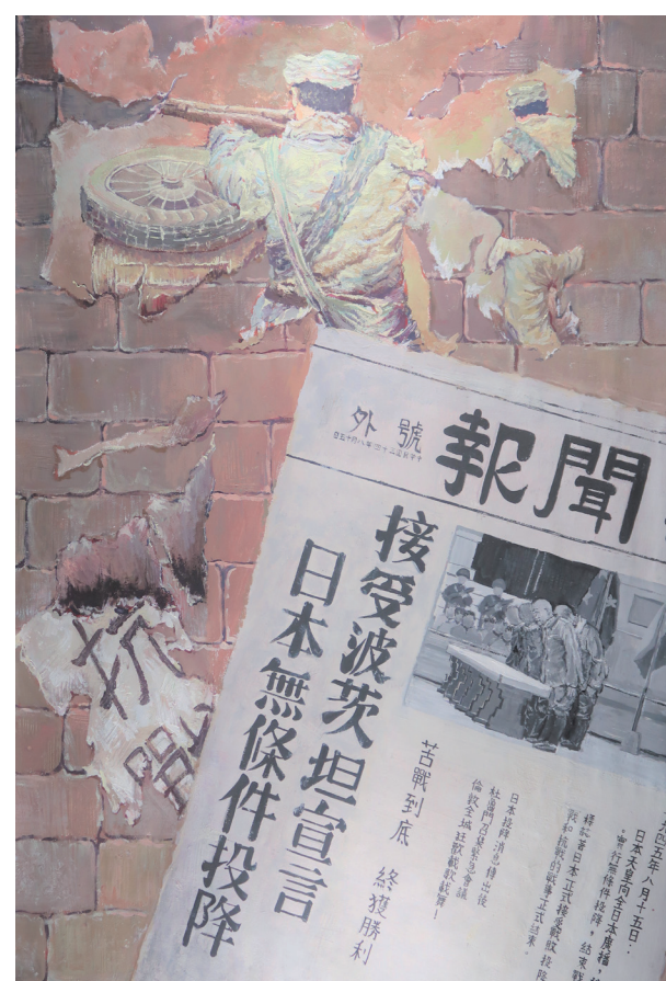
《这一路》 境 172 陈俞璐瑶