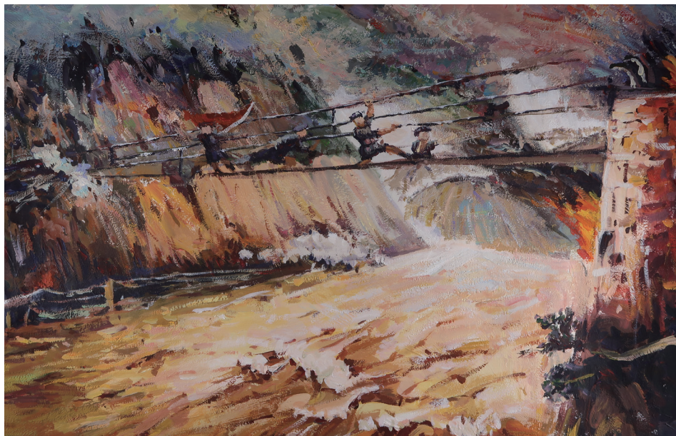
《黎明之前》 境 172 龙思好