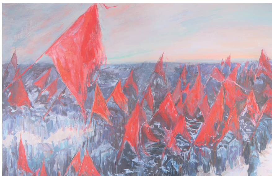
《胜利过后》 境 172 邱益婷