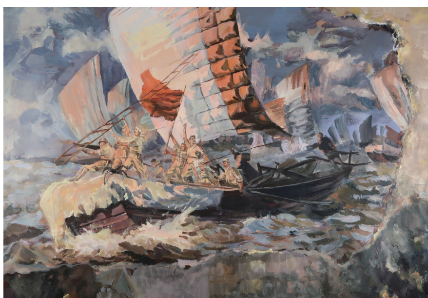
《无畏》 境 161 刘静