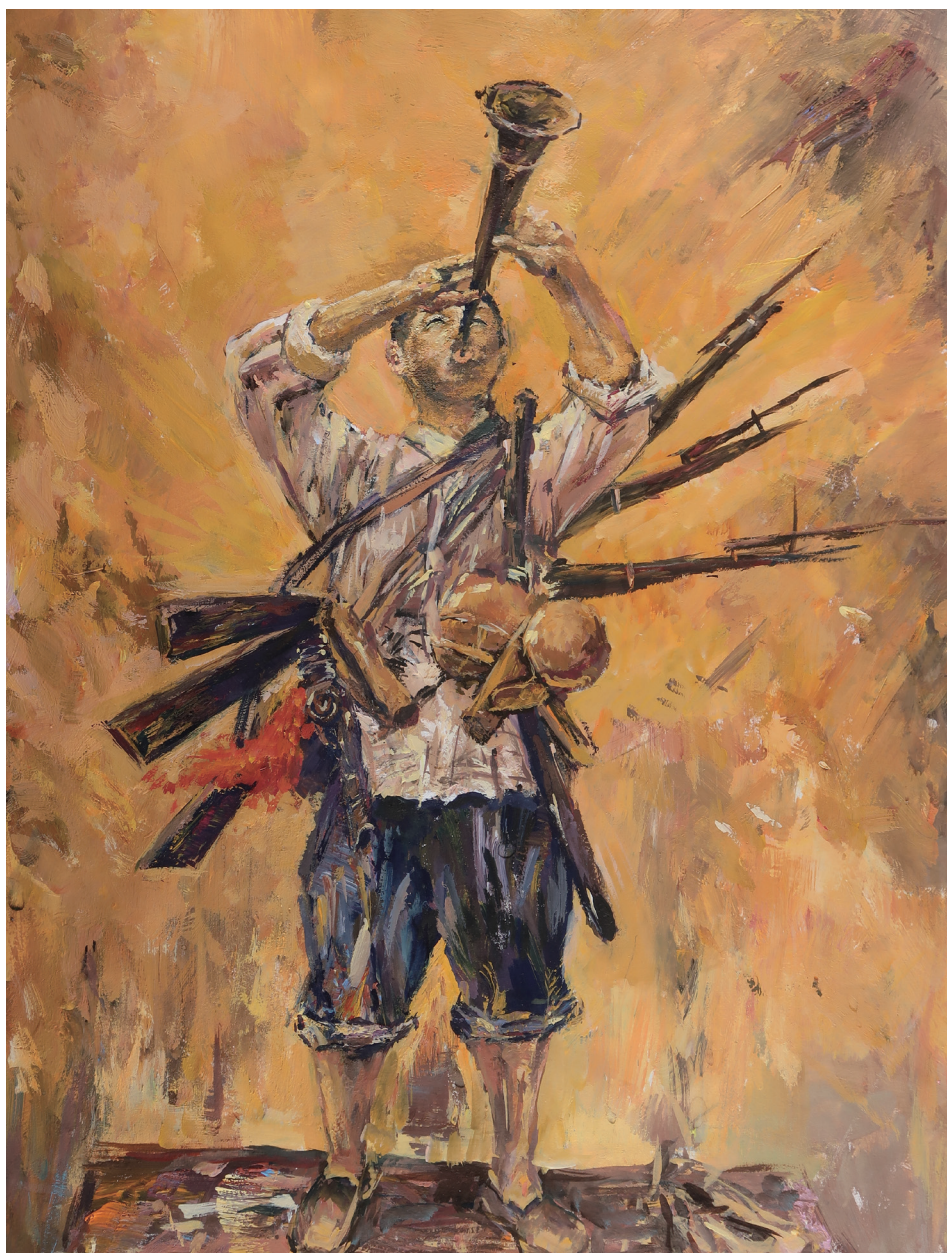
《胜利之音》 境 171 吴俊美