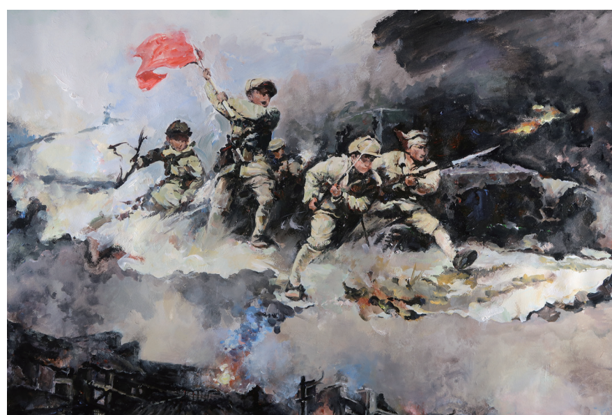
《废墟中“站”起的民族》 境 161 廖诗南