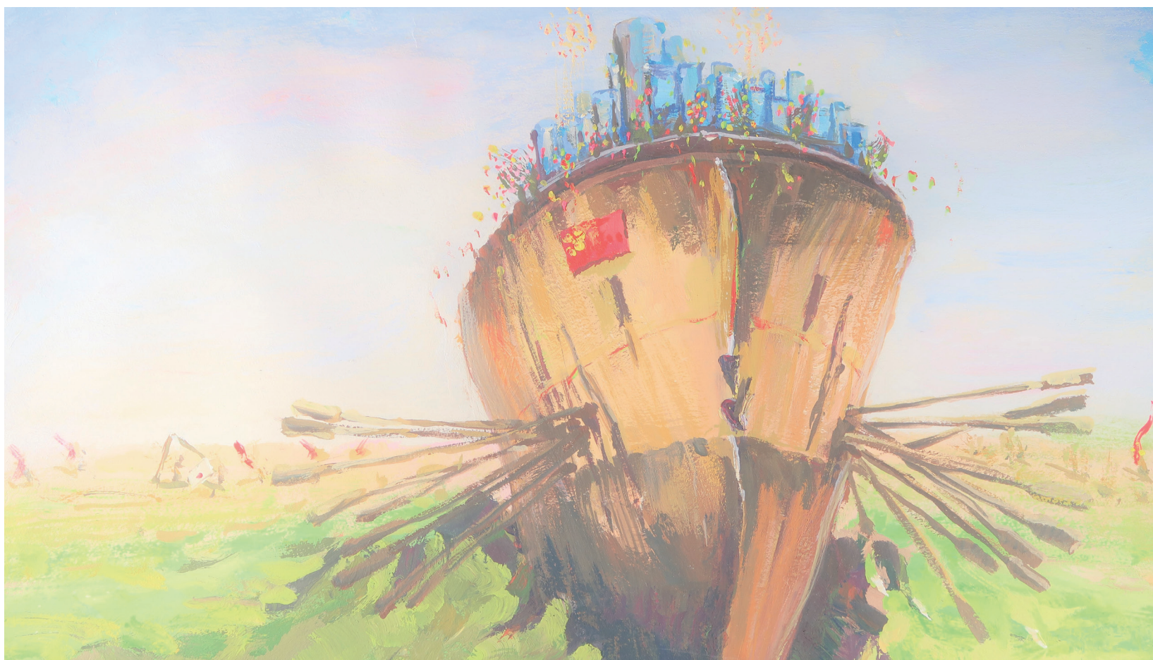
《日新月异》 境 171 申雨晴

作为祖国未来的“90后”大学生群体，他们对于中国的历史和现实具有什么样的认知？脑海中的未来图景又是什么样？